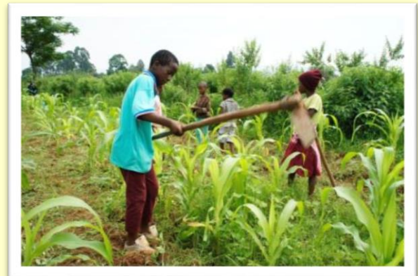
Die Kinder der Grundschule helfen das Maisfeld zu bearbeiten - Links: Die Nähschule in Betrieb